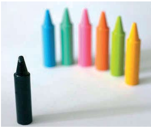
Diskriminacija nanosi štetu pojedincima ali i društvu u cjelini

Kao pučki pravobranitelj već više godina ističem da je vrijeme da se doneseni pravni propisi počnu primjenjivati. Adekvatne kazne su nužne, jer se osim sankcioniranja individualnih počinitelja, kako fizičkih osoba koje čine prekršaje i kaznena djela, tako i odgovornih osoba koje ovo potiču ili ne sprečavaju i svima drugima šalje poruka da se diskriminacija i nasilje neće tolerirati. Međutim, dosljedna primjena propisa samo je jedan segment u naporima koje treba poduzeti. Posebno je potrebno poduzimati više aktivnosti na prevenciji diskriminacije