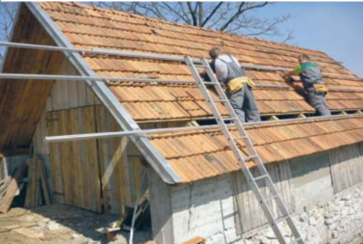
Obnova: Gospodarski razvoj, zaštita okoliša i društvena osjetljivost

potpisa na dokumente u Ajderovcu je pred Uskrs - zasvijetlilo.