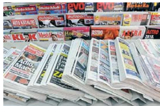
Medijski senzacionalizam protiv kulture tolerancije

Treća presuda, bivšem premijeru Ivi Saderu dočekana je s neskrivenom pažnjom. Ona je prvostupanjska i nije konačna. Reakcije su različite i kreću se u širokom rasponu od prihvaćanja do odbijanja. Jednim dijelom ponavlja se pogreška u razmišljanju i vidljivo je da prva dva suđenja nisu komentatore ničemu naučila. Ali, ipak je tračak razuma prisutan i dio reakcija ukazuje na činjenicu da je to tek prvostupanjska presuda i da treba malo pričekati višu instancu i pravomoćnost presude. Kao da smo jako malo naučili iz pravomoćnih presuda generalima i Čačiću. Objke presude samo su nešto što je sastavni dio sudskog postupka i obje su donesene na temelju prosudbe sudaca na višoj razini. Javnost jednu presudu prihvaća