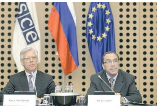
Visoki povjerenik nacionalnih manjina OESS-a Knut Vollebaek i slovenski državni tajnik u Ministarstvu vanjskih poslova Božo Cerar na predstavljanju "Ljubljanskih smjernica o integraciji raznolikih društava" u Ljubljani, 7. studenog 2012.

manjinske političke vođe, političke stranke svih ideoloških provenijencija, privatne gospodarske subjekte, udruge civilnog društva, specijalne interesne skupine (poput sindikata i udruga poslodavaca) i akademsku zajednicu. A u svemu tome posebno je značajna uloga lokalnih i regionalnih vlasti.