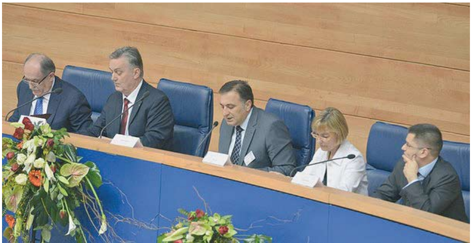
Donatorska konferencija u Sarajevu za pomoć povratku izbjeglica: bez regionalne suradnje država bivše Jugoslavije nije moguće očekivati značajniji povratak izbjeglica

Bilo bi sasvim naivno očekivati da će regionalna suradnja biti uspješnija zato jer će akteri shvatiti kako će takva suradnja pospješiti proces povratka izbjeglica. Štoviše, ni nedavna regionalna konferencija održana u Sarajevu, s ciljem da bude donatorska u smislu da se prikupe dovoljna financijska sredstva za rješavanje bar najakutnijih izbjegličkih pitanja, samo je djelomično ispunila očekivanja. S druge strane valja očekivati da će ta suradnja biti posljedica ekonomske nužnosti u koju će sve ove države nužno dovesti nezaustavljivi euro integracijski procesi.