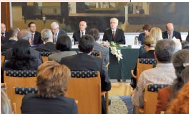
Važnost političke podrške povratku: Predsjednik RH Josipović na sjednici Vijeća za socijalnu pravdu